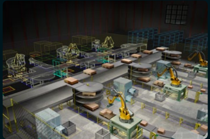
"Rendering of factory interior with DWG™ underlay. Autodesk® Factory Design Suite and Autodesk® 3ds Max® Design software products were used in the design process."

Koeajopäivänä käydään läpi kaikki perussuunnitteluun liittyvät toiminnot kuten mm. piiri- ja logiikka-kaavioiden sekä "älykkäiden" layout- ja kokoonpanokuvien suunnittelu. Myös toiminnot, liittyen raportointiin, projektien kopiointiin ja piirien hallintaan käydään läpi.